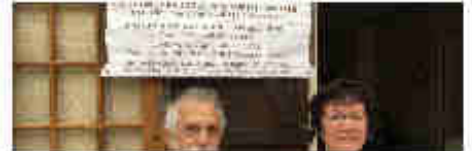
Haute-Marne : un couple de curistes dénonce une "fraude à la sécurité sociale" dans les cures thermales