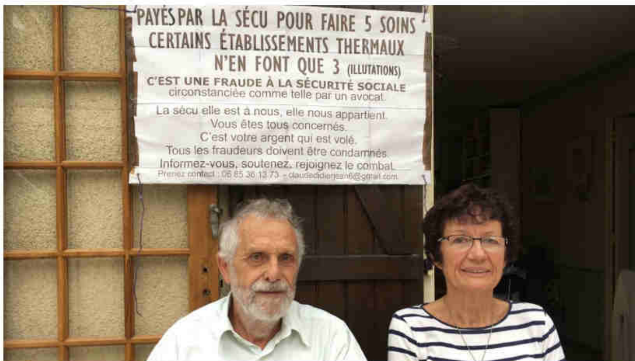
Ce couple installé dans l'Aube dénonce les agissements des établissements thermaux qui ne font pas la totalité des soins prévus par le financement de la CPAM. À Bourbonne-les-Bains (Haute-Marne), on ne fait pas la même lecture de la situation.