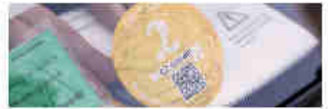
La fin du diesel en 2025 à Strasbourg... mais en 2030 dans l'Eurométropole